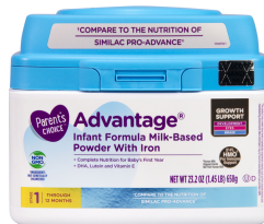
Parent's Choice Infant 12.5oz